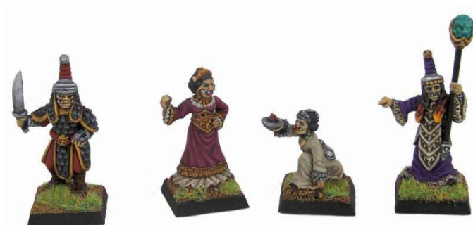
Der Hof der Chaoskönigin. Figuren von Black Hat Miniatures.

Schwarze Garde der Chaoskönigin und andere Nahkämpfer mit Schwertern oder diversen