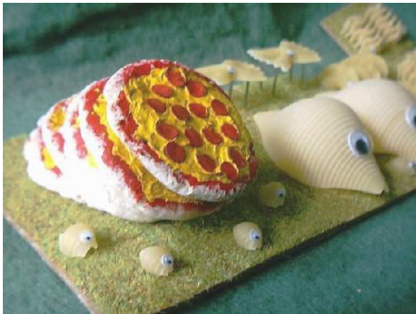
Der schiefe Turm von Pizza mit seinen grimmigen Bewachern (als Armeelager), im Hintergrund fliegende Farfalle und rollende „Sputniks“. Idee und Ausführung: Tim Sharrock.