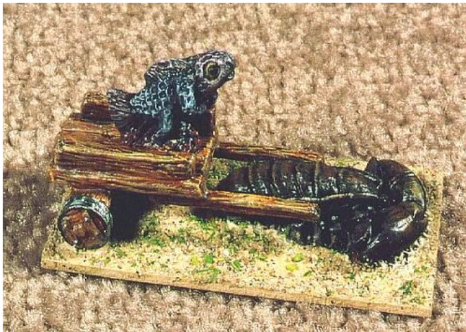
Mein Freund hat Schuppen – und ein großes Auto! Fischmenschen-Streitwagen, gezogen von einem Riesenhummer (und das in diesen Zeiten!), aus der Sammlung von Michael Heckmann, bemalt von Bodo Vaas, Duisburg. Hersteller: Pendraken Miniatures, Foto: Foto-Fachlabor Irma Berndt, Bochum.

Da die Korsaren aus naheliegenden Gründen niemals weit entfernt von der Küste kämpfen, muss in Spielen mit dieser Armee eine der beiden Schmalseiten oder die Langseite der Spielfläche, auf der die Seeräuber aufgestellt werden, von einem Meeresstrand gebildet werden. Am besten würfelt der Gegenspieler die Lage des Gewässers mit einem zwanzigseitigen Würfel aus: bei 1–5 liegt es auf der linken Schmalseite (von ihm aus gesehen), bei 6–15 auf der Langseite, bei 16–20 auf der rechten Schmalseite.