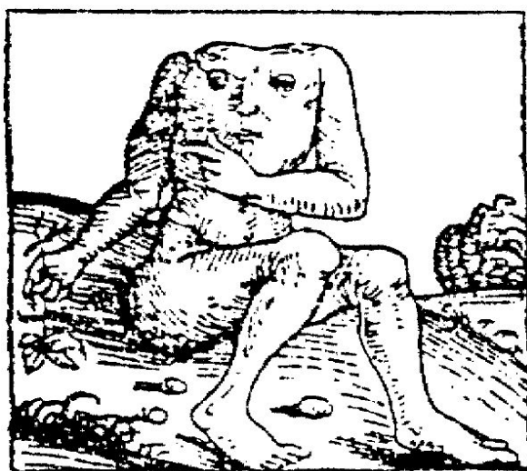
Die kopflosen Menschen aus der Naturgeschichte des älteren Plinius auf einer Abbildung aus der Weltchronik Hartmann Schedels (Nürnberg 1493).