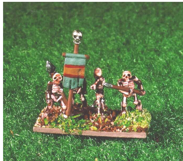
Untote Horden (links) und Speerträger (rechts) aus der Sammlung des Autors. Hersteller: Pendraken Miniatures und Irregular Miniatures, Foto: Foto-Fachlabor Irma Berndt, Bochum.