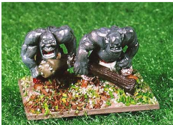
Trollt Euch, die Trolle kommen! Zwei echte Pfundskerle aus der Sammlung des Autors. 10mm-Figuren von Pendraken-Miniatures, bemalt von Bodo Vaas, Duisburg; Foto: Foto-Fachlabor Irma Berndt, Bochum.

Die Kampfstärke der Waldfledermausschwärme beträgt im Nahkampf 2, im Fernkampf 4. Waldfledermausschwärme dürfen am Ende ihrer Bewegung im Gegensatz zu anderen Flugwesen über Wäldern und Gebüsch stehen bleiben. Die „Wilde Jagd“ zählt als Untote im Sinne der Regeln. Wildschweinrotten betrachten Wälder und Gebüsch für die Bewegung als offenes Gelände.