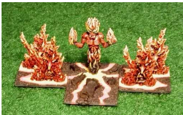
Heiße Sache: Feuerelementargeister aus der Feuerelfen-Armee des Autors, bemalt von Bodo Vaas, Duisburg. Der große Elementargeist in der Mitte stammt von Excalibur Miniaturen, die kleineren von Pendraken Miniatures.