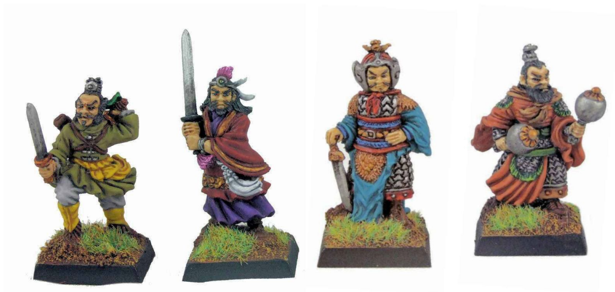
Chinesische Helden. Figuren der Firma Black Hat Miniatures.